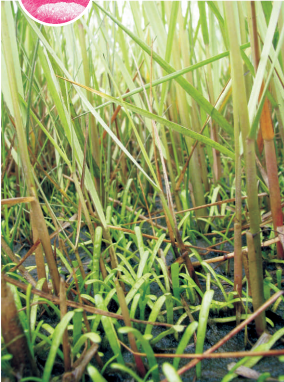
Liléopsis de l'Est dessous la spartine alterniflore