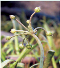
Commencement des fleurs