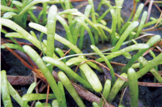
Petites feuilles rondes