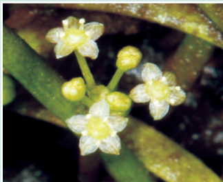
Petites fleurs blanches